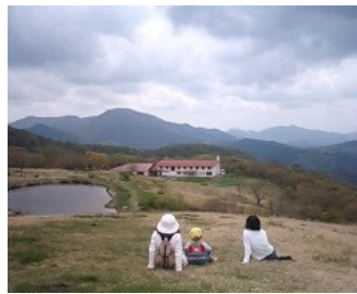
広々。吾妻山でゆったり。