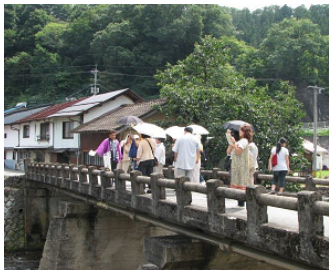
比和ののどかな街なか散策。