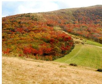
吾妻山の大自然をキャンパスに。