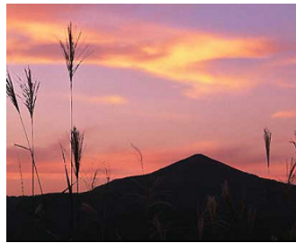
美しい日本の風景があります。

宿場町の面影残る比和のまちなかで、いにしへの写真展鑑賞と漬物など故郷の味が集う「比和のまちなみ」を散策、その情緒をスケッチ。翌日は紅葉の美しい吾妻山の自然をキャンパスにスケッチ。大自然の中でゆったり、のんびりするやまなみの旅です。スケッチに必要な道具は用意しています。初心者の方もお気軽に参加いただけます。