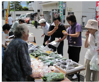
里の味が路端に集う。